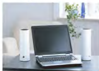
— お問い合わせ・ご用命は —